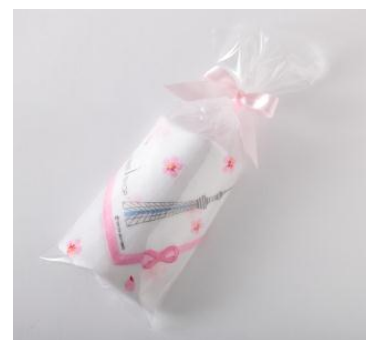
はみ出し刺繍ハンカチ (ピンクリボン 2014)

内 容 東京スカイツリーオフィシャルショップ 「THE SKYTREE SHOP」で人気の桜柄のハンカチーフに ピンクリボンのはみ出し刺繍を施したピンクリボン 限定のハンカチです。