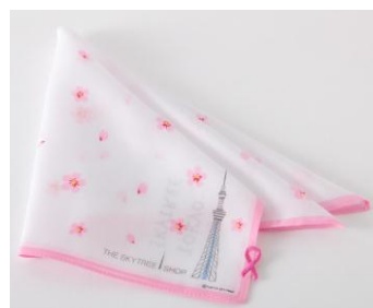
限定商品 はみ出し刺繍ハンカチ (ピンクリボン2014)