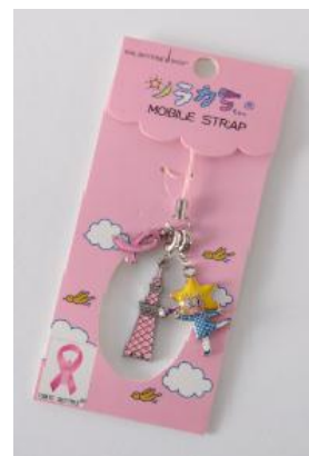
ソラカラちゃんストラップ (ピンクリボン 2014)

内 容 東京スカイツリーオフィシャルショップ 「THE SKYTREE SHOP」の人気商品「ソラカラちゃん ストラップ」のピンクリボンバージョンです。 ストラップには、ピンク色のスカイツリーと ソラカラちゃん、取り外し可能な2つのチャームが ついています。