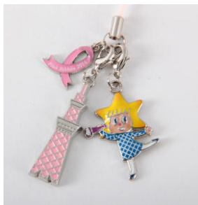
限定商品 ソラカラちゃんストラップ (ピンクリボン2014)