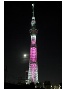
ピンク色の特別ライティング