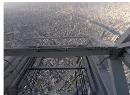
▲「体験!東京アオゾラそうじ」の体験イメージ