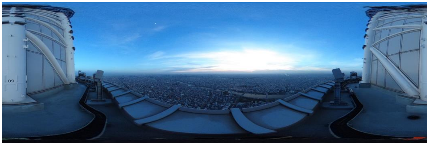
▲「東京スカイツリー®スコープ」コンテンツ映像イメージ(360度映像を平面に展開)