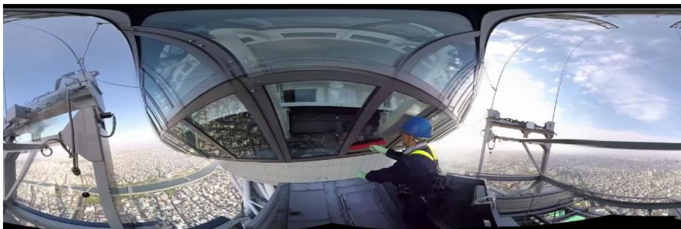
▲「体験!東京アオゾラそうじ」コンテンツ映像イメージ(360度映像を平面に展開)