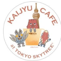
△コースター (イメージ)

限定メニューをご注文いただいた方には、東京スカイツリー限定デザインのコースターをプレゼントします。