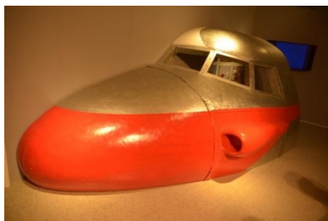
△原寸大ジェットビートル（部分）のフォトスポット（イメージ）