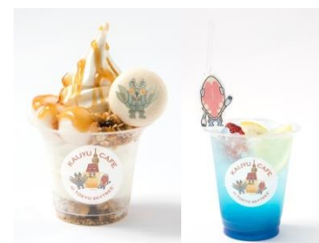
△怪獣カフェの限定メニュー