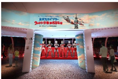
△東京スカイツリー天望回廊装飾（イメージ）