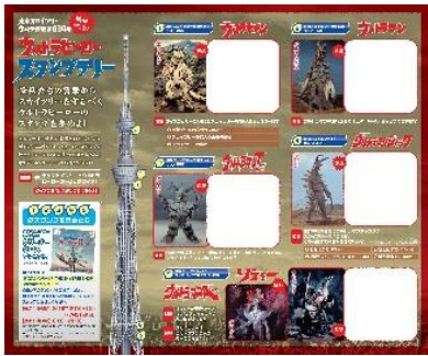
△ウルトラヒーロースタンプラリー台紙とスタンプ (イメージ)