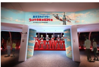
△東京スカイツリー天望回廊装飾（イメージ）