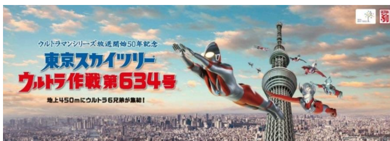
△メインビジュアル