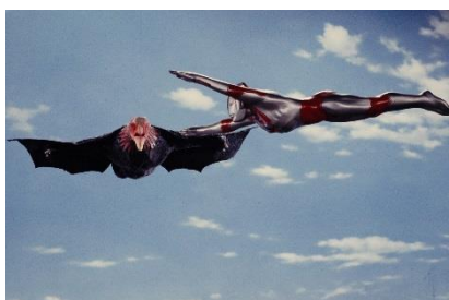
△「空」にまつわるシーンの場面写真（イメージ）