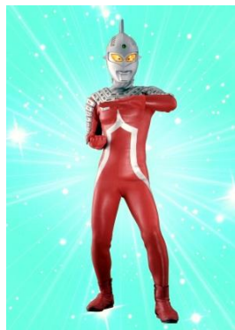
△ 左) ウルトラマン 右) ウルトラセブン