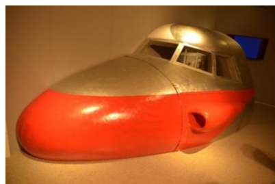
△原寸大ジェットビートル（部分）のフォトスポット（イメージ）