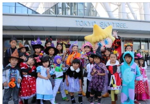
昨年実施したハロウィンパレードの様子