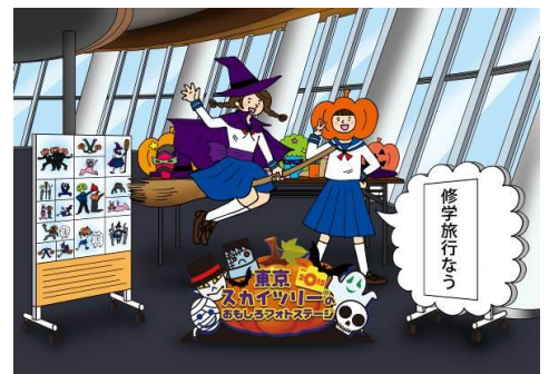
東京スカイツリー®おもしろフォトステージ(イメージ)