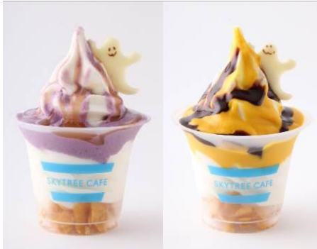
紫いもソフト(左) / かぼちゃソフト(右) 各¥550

東京スカイツリー展望台内の「SKYTREE CAFE」では、9月18日(金)～10月31日(土)までの期間、ハロウィン限定スイーツをご用意します。