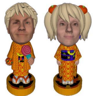
3Dフィギュア (イメージ)

期 間 10月10日(土)、11日(日)、12日(月・祝)、 24日(土)、25日(日) 時 間 10:00～21:00 場 所 東京ソラマチ イーストヤード1階 料 金 有料 ※指定した衣装などにより料金が異なります。