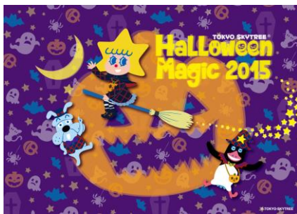
2015年メインビジュアル