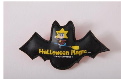
ソラカラちゃん こもりバッジ ハロウィン ¥400

箱は仕掛けつきで、中のスリーブを上げると、ハロウィンの魔法にかかったスカイツリーが出てきます。中にはチョコレートパイを入れました。