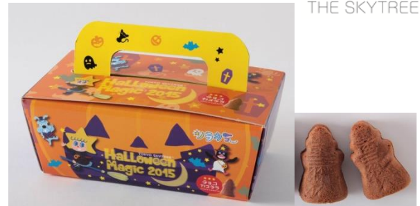
ソラカラちゃん ハロウィンチョコカステラ ¥800

ハロウィンコスチュームのソラカラちゃんが、オバケをぎゅっとしているマスコット。持ち手をひっぱるとソラカラちゃんとオバケがブルブル動きます。