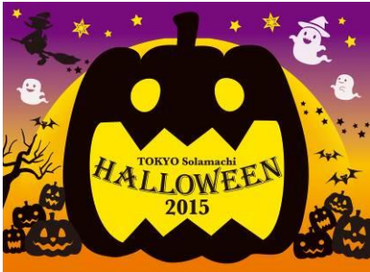
東京ソラマチ ハロウィン2015 メインビジュアル

期 間 10月9日(金)～10月31日(土) 場 所 東京スカイツリータウン1階 ソラマチひろば 東京ソラマチ1階 ソラマチ商店街