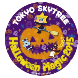
ハロウィン限定ステッカー(イメージ)