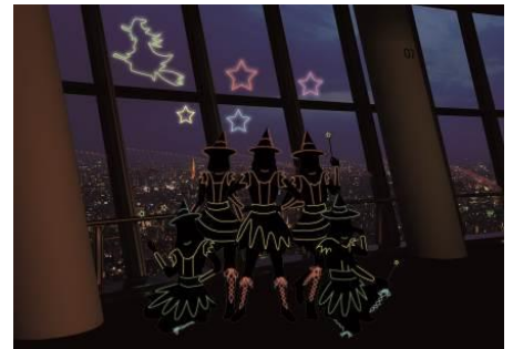
東京スカイツリー® 光のハロウィンダンスパフォーマンス (イメージ)

期 間 10月 毎週金・土曜日 時 間 17:45/18:30/19:45/20:30 (各回約10分) 場 所 東京スカイツリー天望デッキ フロア350 ※場所や時間に変更となる場合がございます。