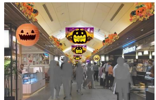
“ハロウィン村” (イメージ)