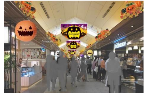
“ハロウィン村”(イメージ)