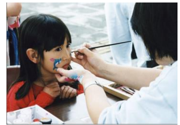
フェイスペイント(イメージ)

期 間 10月24日(土)、25日(日)、31日(土) 時 間 10:00～16:00 場 所 東京スカイツリータウン1階 ソラマチひろば 料 金 300円～(税込・1名様)