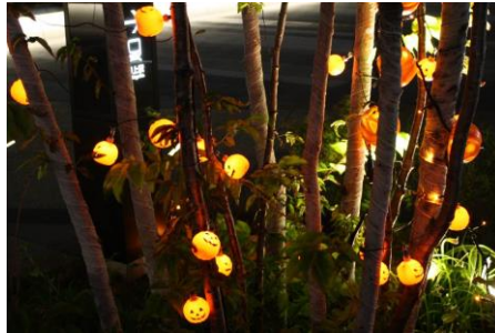
ハロウィンイルミネーション(過去の様子)