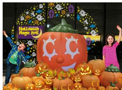
ハロウィンデコレーション(イメージ)