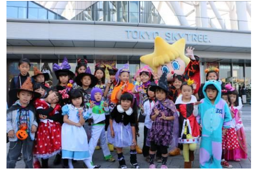
昨年実施したハロウィンパレードの様子

今年で4回目となるハロウィンパレードは、各回約150名の規模に拡大し、親子で仮装を楽しめます。ソラマチ商店街やスカイアリーナなどを練り歩いた後、東京スカイツリー公式キャラクターソラカラちゃんのダンスに参加し、記念写真を撮影できます。