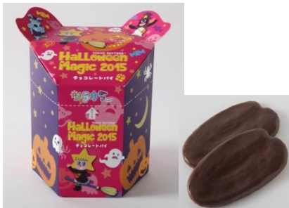
ソラカラちゃん ハロウィンチョコレートパイ ¥800

ハロウィンコスチュームのソラカラちゃんたちを描いた箱の中に、スカイツリー型のチョコカステラを入れました。