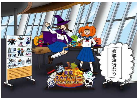
東京スカイツリー®おもしろフォトステージ (イメージ)