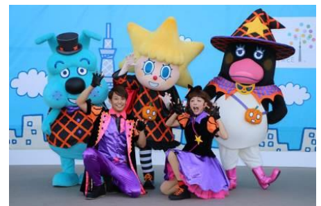
ソラカラちゃんのマジカル☆ハロウィンダンス! (昨年の様子)

期 間 9月18日(金)～10月31日(土)までの 土日祝日 ※10月10日(土)、24日(土)は除く 時 間 10:00/11:30/13:30/15:00 (各回約20分) 場 所 東京スカイツリータウン4階 スカイアリーナ 特設ステージ ※荒天時は、場所や時間に変更となる場合がございます。 ※10月24日(土)はソラカラちゃん生誕5周年記念特別イベントになります。