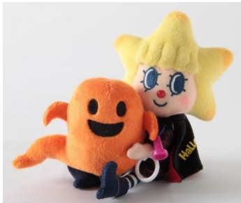
ソラカラちゃん ブルブルマスコット ハロウィン2015 ¥1,680

東京スカイツリーの、1階・5階・天望デッキ フロア345にあるオフィシャルショップ「THE SKYTREE SHOP」では、9月18日(金)～10月31日(土)までの期間、ハロウィン限定商品を販売します。