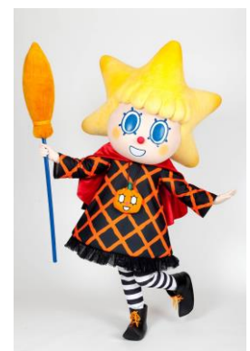
ハロウィン限定コスチュームのソラカラちゃん

期 間 9月18日(金)～10月31日(土) ※「ソラカラちゃんのマジカル☆ハロウィンダンス!」 開催日および10月24日(土)は除く。 時 間 9:00/10:30/13:30/15:00/16:30 (各回約15分) 場 所 東京スカイツリー天望デッキ フロア350