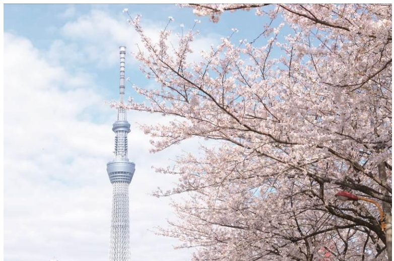
△桜と東京スカイツリー（2013年撮影）