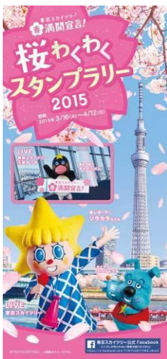
△スタンプラリー台紙（イメージ）