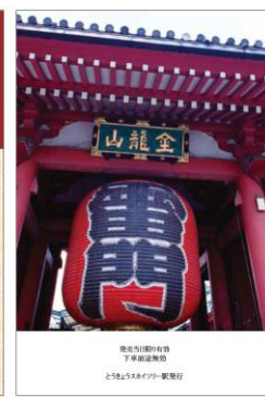
△とうきょうスカイツリー駅販売デザイン（イメージ） （左：表面、右：裏面）