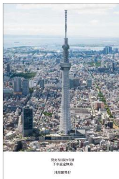
△浅草駅販売デザイン（イメージ） （左：表面、右：裏面）