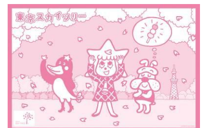
△レジャーシート (イメージ)