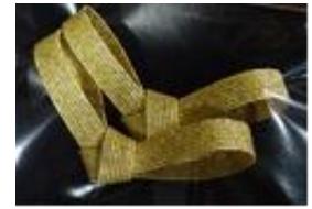
△ノベルティの箸置き（イメージ）