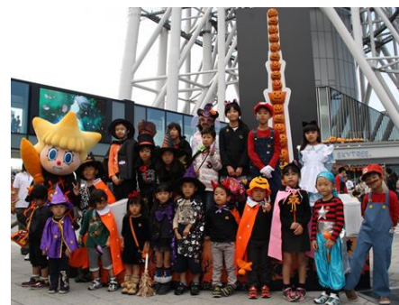
過去に実施した東武鉄道ボンボキッズイベントの様子