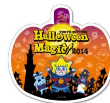
ステッカー (イメージ)