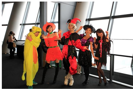
仮装 de ハロウィンウィークエンド☆ (イメージ)