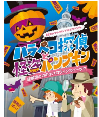
ハラペコ探偵と怪盗パンプキン (メインビジュアル)

怪盗パンプキンが東京スカイツリータウンにバラまいた謎をハラペコ探偵と協力しながら解決していくというストーリーの謎解きイベントです。謎を解きながら物語の主人公になりきって、東京スカイツリータウンの魅力やトリビアを発見できます。