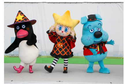
ソラカラちゃんの マジカル☆ハロウィンダンス! (昨年の様子)

ハロウィン限定コスチュームのソラカラちゃん、スコブルブル、テッペンペンと一緒に、ハロウィンアレンジの楽曲で楽しく踊れる参加型ダンスプログラムを行います。