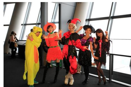
仮装 de ハロウィンウィークエンド☆ (イメージ)

東京スカイツリーでは、期間中に仮装して展望台にご来場いただいたお客様に、オリジナルグッズをプレゼントします。なお更衣室を東京スカイツリータウン内にご用意します。