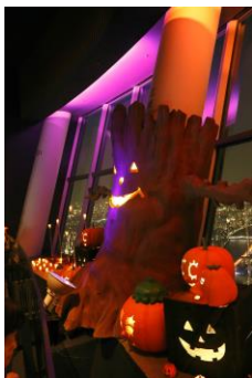
ハロウィン期間の展望台 (昨年の様子)