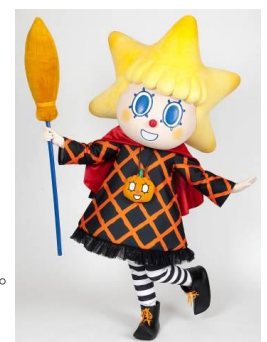
ハロウィン限定 コスチュームの ソラカラちゃん