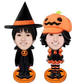
3Dフィギュア (イメージ)