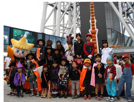
過去に実施した東武鉄道ボンボキッズイベントの様子