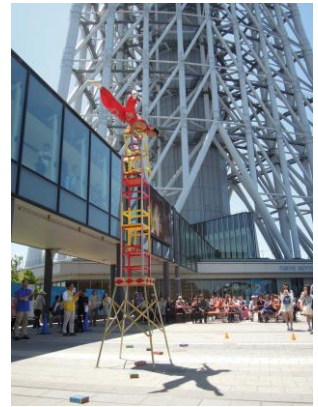
大道芸イメージ (過去の様子)