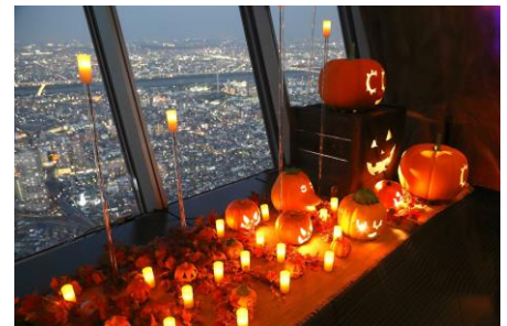
東京スカイツリー館内装飾 (昨年の様子)