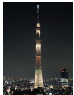
▲2020年東京オリンピック・パラリンピック招致特別ライティング

初点灯のライティング。白一色におごそかに輝くスカイツリーに 交点照明の赤・黄・緑などがそっと彩りをそえるライティング