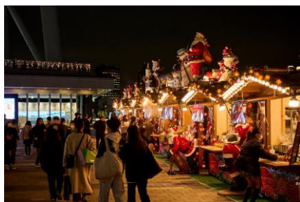
△クリスマスマーケット（過去の様子）

期 間 2023年11月9日（木）～12月25日（月） 時 間 11：00～22：00（L.O. 21：00） 場 所 東京スカイツリータウン4階 スカイアリーナ