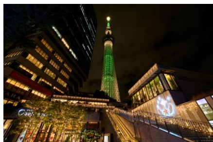
△イルミネーション（過去の様子）

期 間 2023年11月9日（木）～12月25日（月） ※一部のイルミネーションは2024年3月10日（日）まで点灯予定です。 時 間 16：00～24：00 場 所 東京スカイツリータウン各所