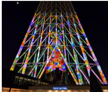
△過去の様子(左:塔体へのマッピング 右:ソラカラちゃん登場)