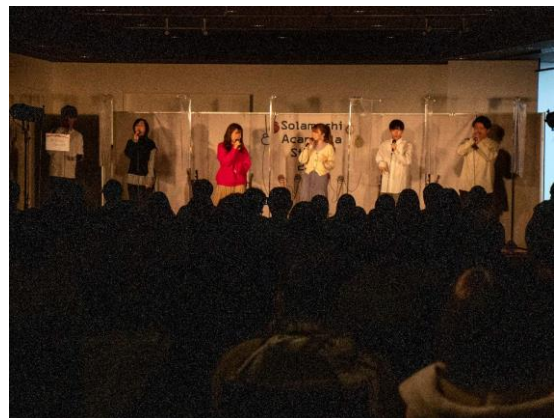
△ソラマチアカペラストリート(過去の様子)