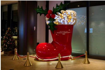
△館内装飾（過去の様子）