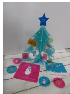
△クリスマスツリーキットを組み立てたもの