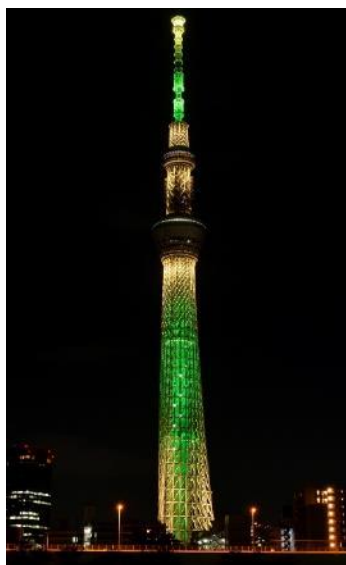
△シャンパンツリー