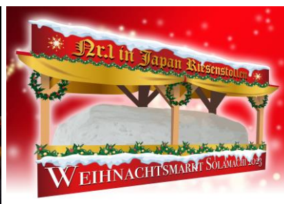
△巨大シュトーレン（イメージ）