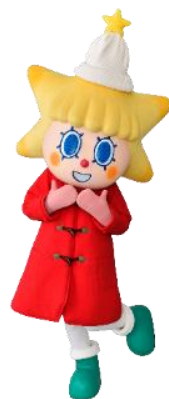
△ソラカラちゃん（過去衣装） 新衣装はお楽しみに！