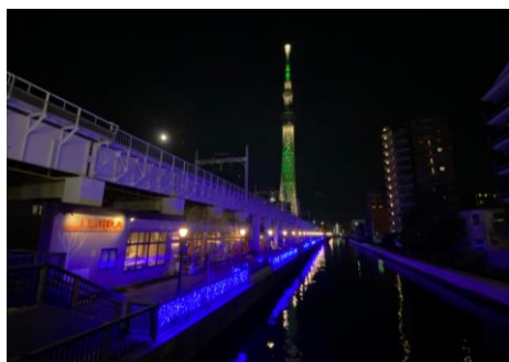
△東京ミズマチのイルミネーション（過去の様子）

期 間 2023年11月9日（木）～2024年1月31日（水） 時 間 17:00～22:00 場 所 牛嶋神社