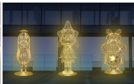
△今年新たに登場する 「twinkle three stars」（イメージ）