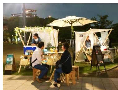
△ナイトマルシェ（イメージ）

※すみだリバーウォークと隅田公園竹あかりライトアップ、ナイトマルシェは、東京都・（公財）東京観光財団の「夜間・早朝利活用促進助成金」を活用して実施しています。