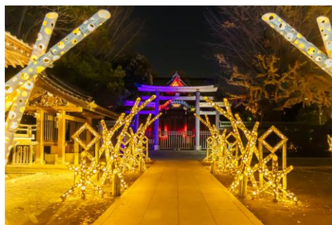
△牛嶋神社（昨年の様子）