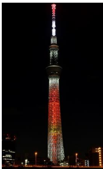
△キャンドルツリー