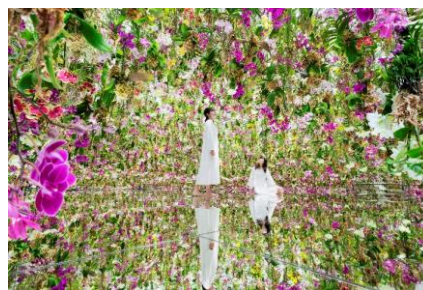
チームラボ《Floating Flower Garden; 花と我と同根、庭と我と一体》 ©チームラボ