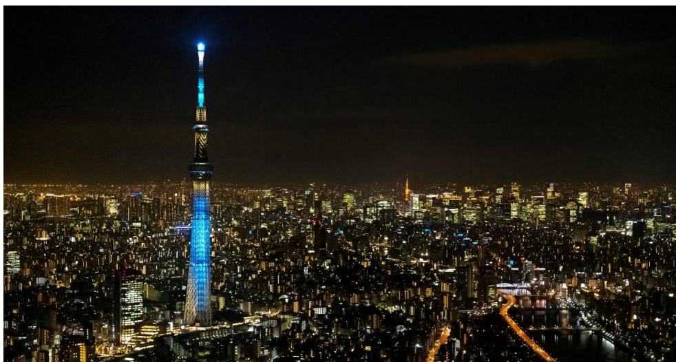
△東京の夜を彩る東京スカイツリーのライティング