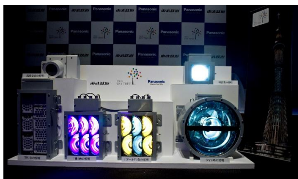
△新たに開発された照明機器（2011年当時）

そして、2011年6月、ライティング機器の仕様を決定。1,995台の照明機器すべてを、省エネルギーに優れたLED照明機器とし、それらを高速制御するLED演出システムを開発することを発表しました。当時、これほどまで大きな建造物をLED照明機器で演出する技術はなく、かつ、634mという高所における過酷な環境にも耐えることが可能な「耐久性」「安全性」を有する、新しいLED照明機器を開発することとなりました。