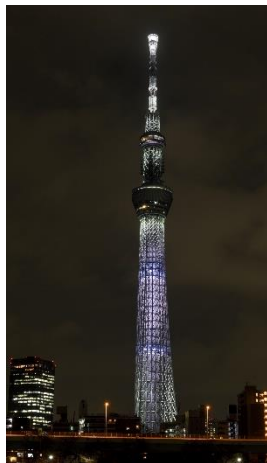
△白色のライティング (3月10日東京大空襲)