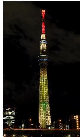
△特別ライティング「明花」 (3月11日東日本大震災)

そして—。2020年、世界は大きな危機に包まれました。世界中に拡大した新型コロナウイルス感染症により、世界は一変。人と人の距離が離れ、国と国との行き来も制限され、世界中が分断されていきました。