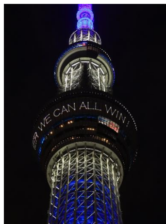
△地球をイメージした青色の特別ライティングとレーザーマッピングによるメッセージ

「光」は、人々の気持ちを前向きにし、明るくしてくれる、そんな不思議な力があります。