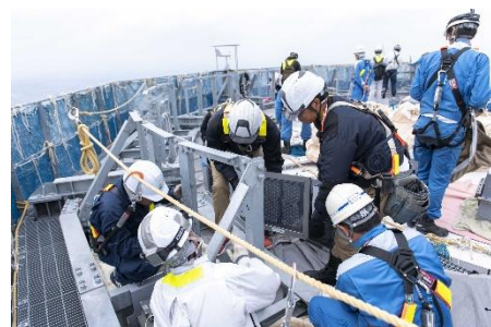
△ゲイン塔頂部での照明機器増設工事