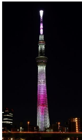
△特別ライティング「舞」

また、3月10日の東京大空襲や3月11日の東日本大震災の日には、追悼や復興の気持ちを込めた特別ライティングを、毎年、点灯するなどしてきました。