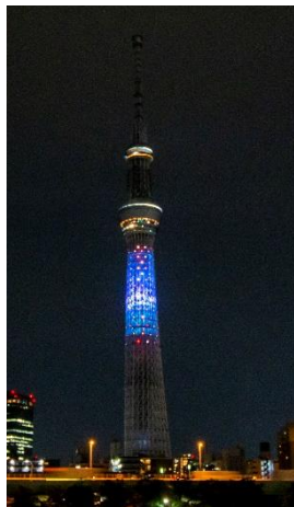
△特別ライティング「花火」