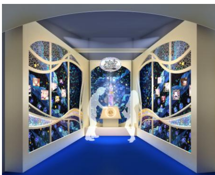
天望回廊 フロア450 ソラカラポイント 「願いの灯」