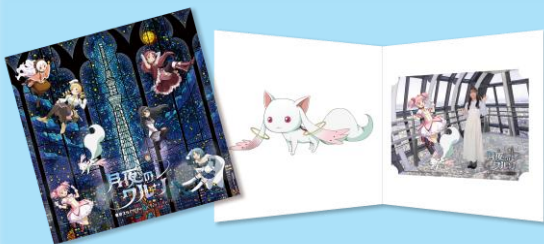
△表紙とイベント限定台紙（イメージ）

期 間 2026年1月8日（木）～4月6日（月） 時 間 月～金 10：00～21：30 土・日・祝 9：00～21：30 ※時間は変更になる場合があります。 場 所 東京スカイツリー天望回廊 フロア445 フォトサービス 料 金 1枚：1,700円