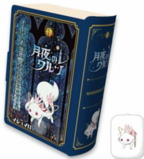
ブック型マシュマロ (864円)