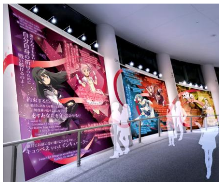
天望回廊 フロア450 スロープ 「覚悟の路」