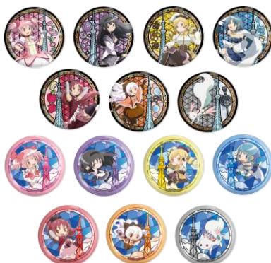
ブラインドホログラム缶バッジ (全14柄) (550円) ※コンプリートセットもございます。