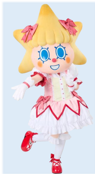
限定コスチュームを着た ソラカラちゃん▷

期 間 2026年1月8日（木）～4月6日（月） 時 間 1月8日（木）～1月31日（土） 10：30／13：30／15：00／16：00 2月1日（日）～4月6日（月） 10：30／13：30／15：00／16：30 場 所 東京スカイツリー天望デッキ フロア350 ※内容は予告なく変更または中止となる場合がございます。