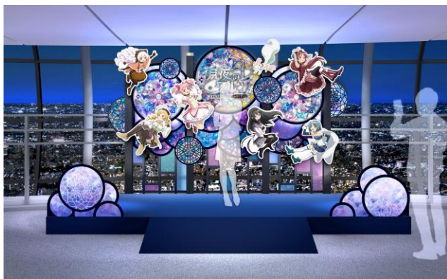
天望回廊 フロア445 ウェルカムエリア 「月夜のホワイエ」