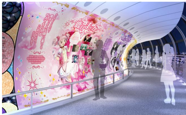
天望回廊 フロア445～450 回廊エリア 「追憶のギャラリー」