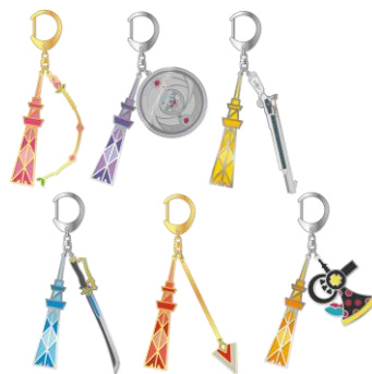
スタンドグラス風キーホルダー (全6種) (各2,640円)