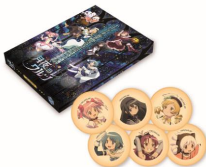
プリントクッキー (1,404円)