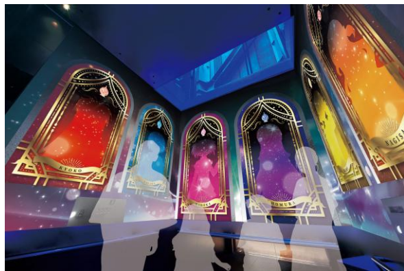
天望シャトル（エレベーター） 「はじまりの扉」

地上450メートルの天望回廊を中心に、『魔法少女まどか☆マギカ』のキャラクターたちが大集結！イベントのキービジュアルを使用した展示装飾やフォトスポットなどを設置します。