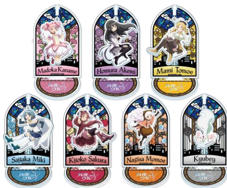
ゆらゆらアクリルスタンド (全7種) (各1,980円)

※ご購入はお一人様一会計のみとさせていただきます。お会計時にチケットの確認をさせていただく場合がございます。