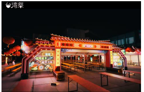
△台湾祭in 東京スカイツリータウン® 2025 (イメージ)