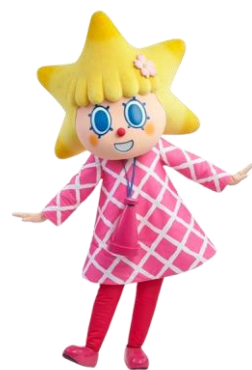
△春限定コスチューム姿のソラカラちゃん