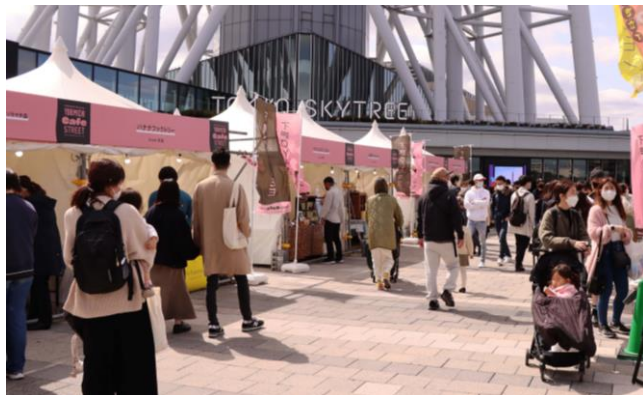
△YORIMICHI Cafe STREET（過去の様子）