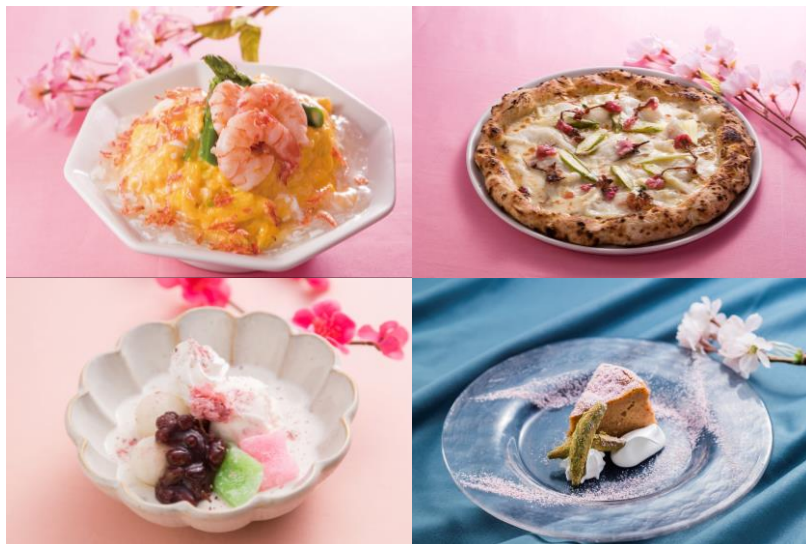
△ さくらメニュー&スイーツ (イメージ)