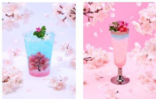
△限定カフェメニュー（イメージ）