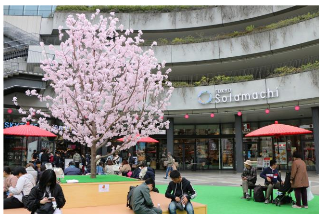
△ソラマチひろばの桜の造花（過去の様子）