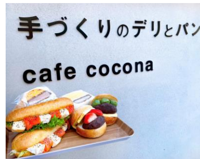
手作りのデリとパン cafe cocona

東向島の和菓子店「いちや」が手がける甘味処。大福やどら焼き、季節限定の苺大福はぜひ味わいたい逸品。