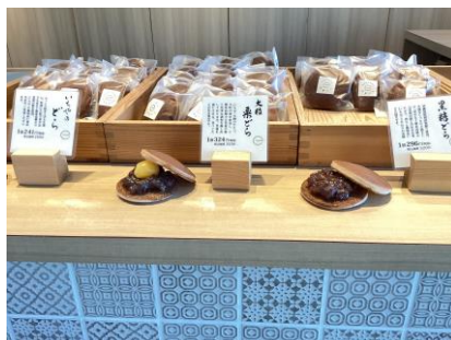
いちや東京ミズマチ店

濃厚な味わいの大人のプリンと紅茶のお店。イベントではカラメル、チョコのほか新しい味のプリンにも注目。