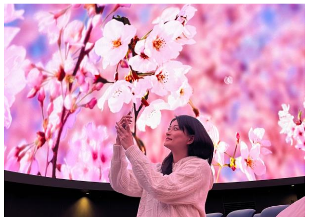
△ ウェルカム映像上映の様子（イメージ）