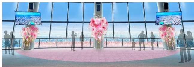
△天望デッキの様子（イメージ）