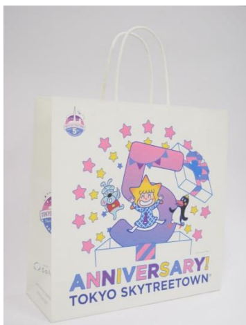
オリジナルショッパー（イメージ）

また、5月22日（月）からは、東京スカイツリーオフィシャルショップ「THE SKYTREE SHOP」と連携し、1会計1,000円（税込）以上お買い上げのお客さまに、オリジナルピンバッジをプレゼントします。さらに、合計5,000円（税込）以上お買い上げのお客さまには、ソラマチギフトカード（最大10万円分）が当たる、5周年感謝祭プレゼント抽選会を実施します。