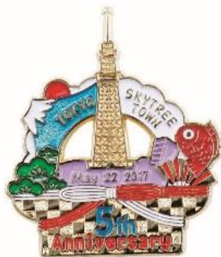
オリジナルピンバッジ（イメージ）