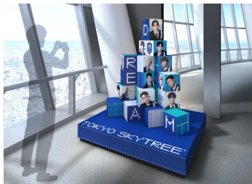
△天望デッキフォトスポット (イメージ)