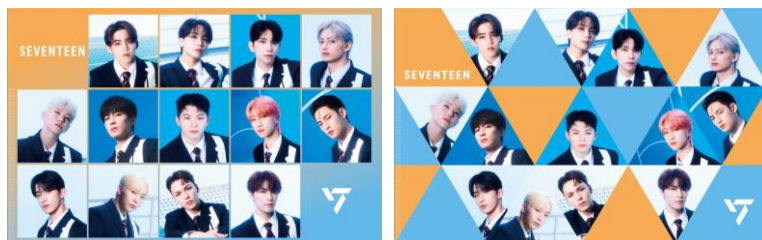
△限定マルチケース (全2種類)