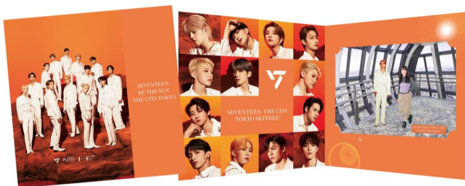
△オリジナル台紙 (イメージ)

場 所 天望回廊 フロア445 フォトサービス 場 料 1枚：2,200円 場 間 10:00～20:30