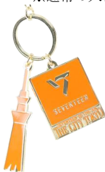
△限定キーチェーン (イメージ)