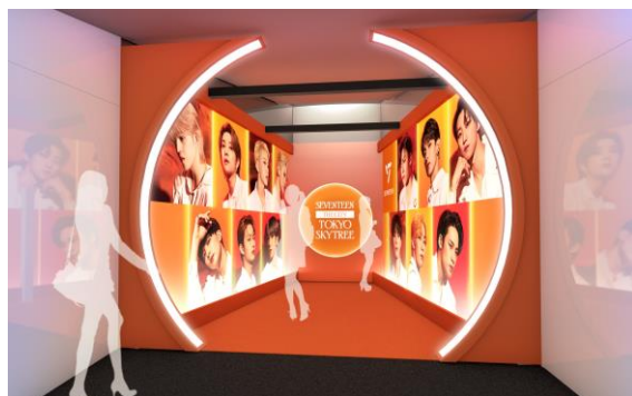
△天望回廊フォトスポット (イメージ)