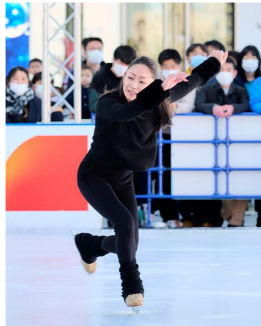
△2022年1月に行われたセレモニーの様子