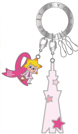
△ソラカラちゃん ピンクリボンキーホルダー (左:本体 右:パッケージ込み)