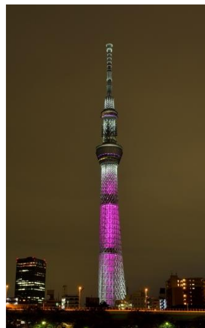
△ピンク色の特別ライティング (過去の様子)

(2) 内 容 乳がんキャンペーンのイメージカラーであるピンク色の特別ライティングを点灯します。