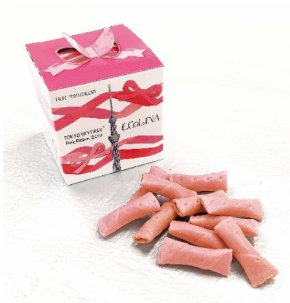
△東京スカイツリー ピンクリボンエコリーナ

および「一般社団法人Japan Breast Cancer Research Group」に寄付します。