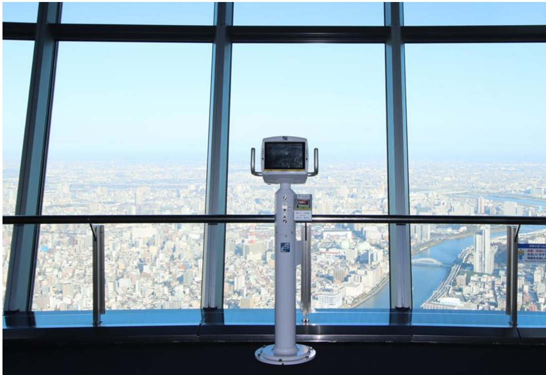
△設置する高精細望遠鏡