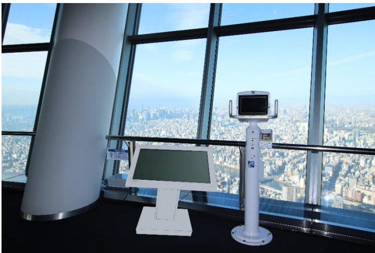
△高精細望遠鏡と55インチ大型モニター（イメージ）