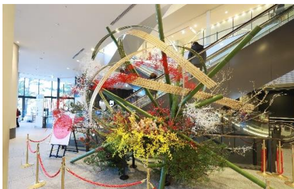
△初空華道展（過去の様子）