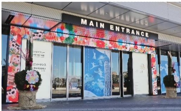
△東京スカイツリー 4階正面エントランス門松およびゲートビジョン装飾（過去の様子）