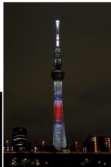
△レーザーマッピングのメッセージ(左)と日本国旗をイメージした特別ライティング(右)(過去の様子)