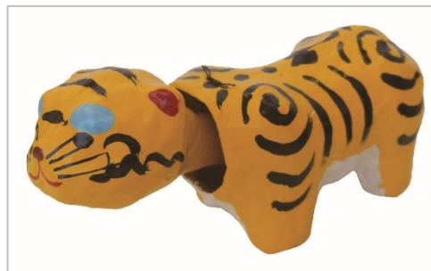
△郷土玩具の一例 石川県南部の加賀魔除虎