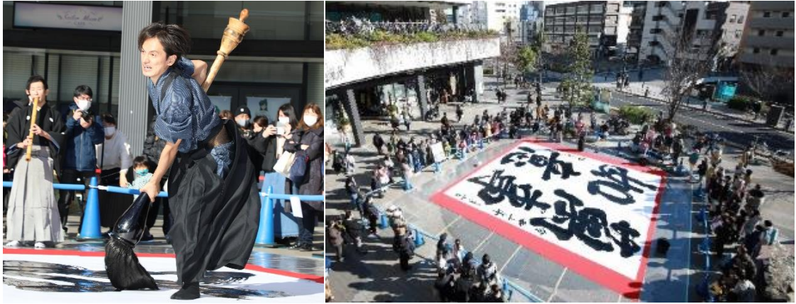
△初空書道パフォーマンス(過去の様子)

期 間 2022年1月2日(日)、3日(月) 時 間 13:00 ※約30分間(予定) 場 所 東京スカイツリータウン1階 ソラマチひろば ※雨天の場合は場所が変更となります。