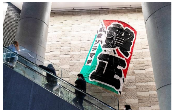
△春日部の大凧（過去の様子）