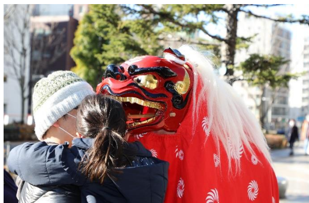
△ソラマチひろばでの獅子舞のお出迎え(過去の様子)