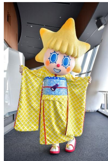
△晴れ着姿のソラカラちゃんのグリーティング(過去の様子)