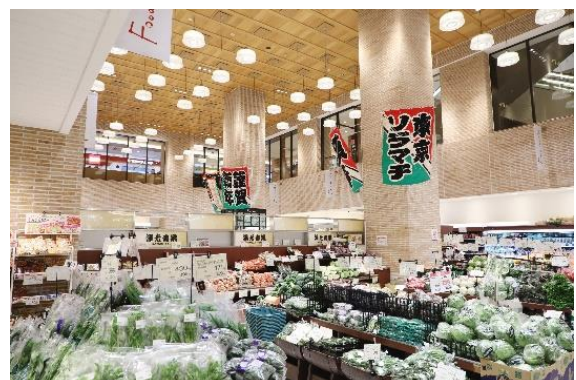
△春日部の大凧（過去の様子）