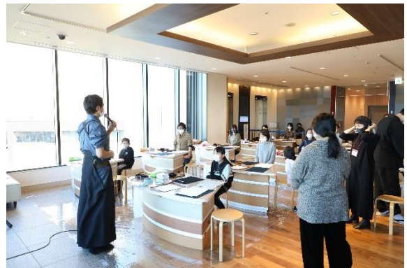
△書初めワークショップ (過去の様子)

期 間 2022年1月2日(日)、3日(月) 時 間 14:00 / 14:30 / 15:00 / 15:30 / 16:30 / 17:00 / 17:30 / 18:00 ※各回約20分間 場 所 東京ソラマチ イーストヤード5階 特設会場 参加費 無料 参加人数 1回約10名様