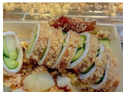
△台湾フード（イメージ）