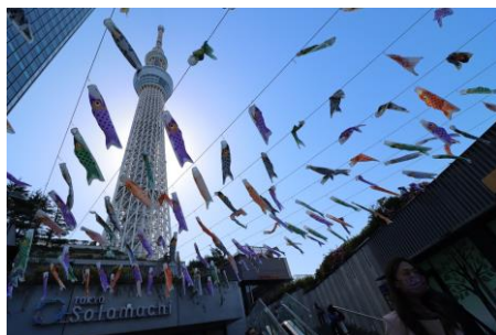
△ソラミ坂（昨年の様子）