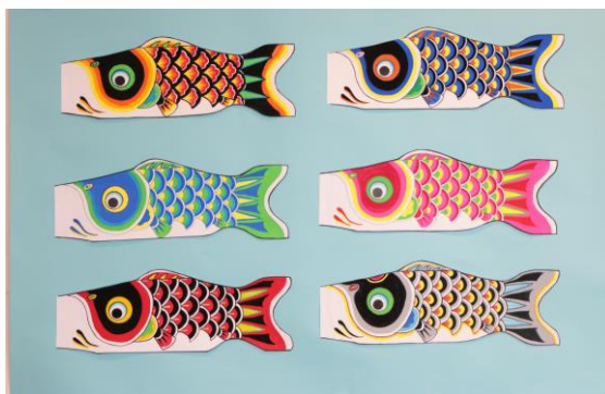
△手描きこいのぼり作品例