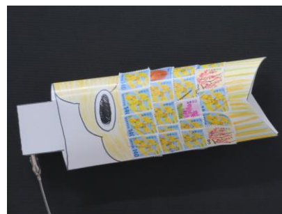
△使用済み切手を使ったこいのぼり （イメージ）