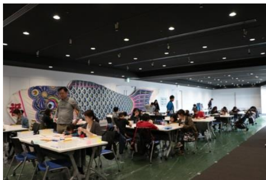
△手描きこいのぼり教室(過去の様子)

期 間 2024年4月13日（土）、14日（日） 場 所 東京ソラマチ® タワーヤード3階6番地 特設会場 料 金 500円（予定）