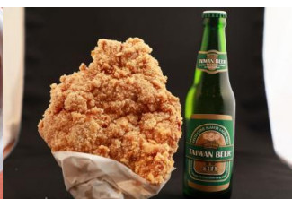
△大鶏排（ダージーパイ）