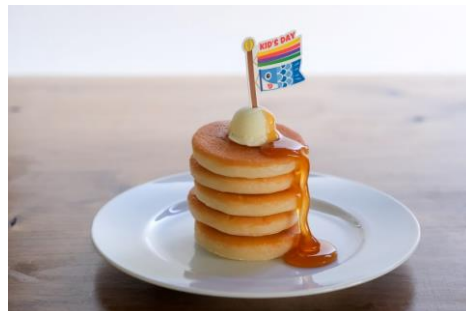
△「ホットケーキ」こいのぼりスペシャルVer. (イメージ)