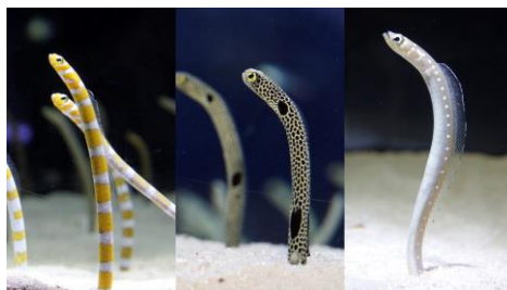
△左からニシキアナゴ、チンアナゴ、ホワイトスポットドガーデンイール