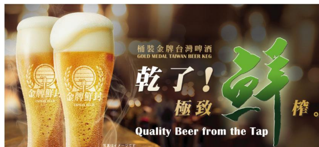
△台湾生ビール（イメージ）