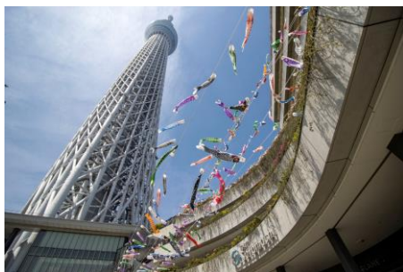
△ソラマチひろば（昨年の様子）