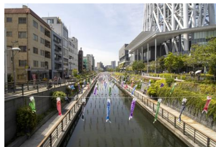
△北十間川（昨年の様子）