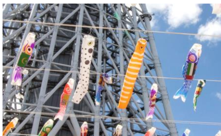
△チンアナゴのぼり、ニシキアナゴのぼり（昨年の様子）

すみだ水族館では、巣穴から細長い体を伸ばすチンアナゴの姿が数字の「1」に似ていることから、11月11日を「チンアナゴの日」と定めており、今年で制定11周年を迎えます。今回は、たくさんのこいのぼりにまぎれて空を泳ぐ「チンアナゴのぼり」と「ニシキアナゴのぼり」を11匹ずつ追加し、掲揚します。そして、今年新たにチンアナゴとニシキアナゴと一緒に水槽で暮らす「ホワイトスポットドガーデンイール」の外見をモチーフにしたのぼりが11匹仲間入り！東京スカイツリータウンのどこかを泳ぐチンアナゴのぼりたち3種を、ぜひ探してみてください。