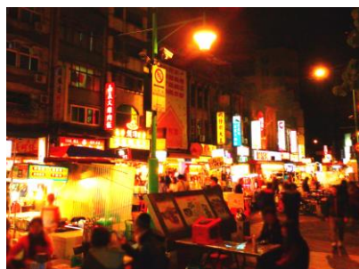
△寧夏夜市（イメージ）