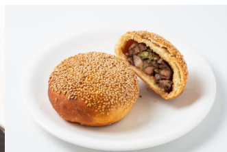
△胡椒餅（フージャオピン）