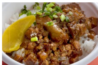
△魯肉飯（ルーローファン）