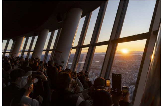
△過去の特別営業（2024年の様子）