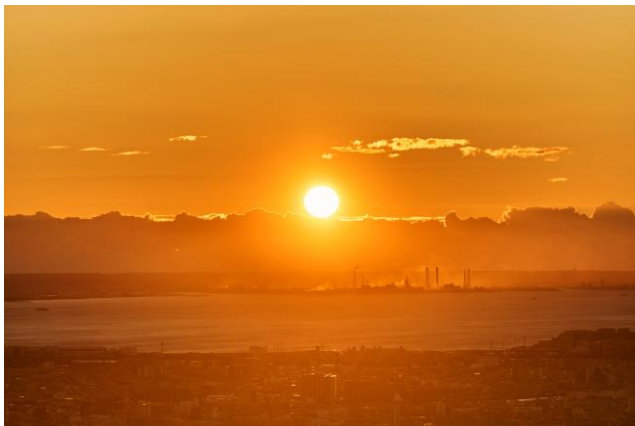
△展望台から見た初日の出（2024年の様子）