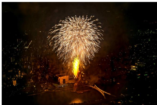
△展望台から見た花火（2019年）