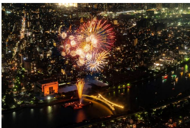
△展望台から見た花火（2019年）