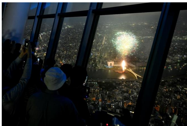
△2019年の隅田川花火大会特別営業の様子