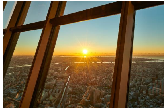
△東京スカイツリー展望台から眺めた初日の出（2021年の様子）