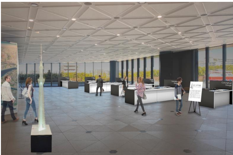
△『東京スカイツリー®開業10周年特別企画 「新タワーデザイン展覧会」』展示イメージ