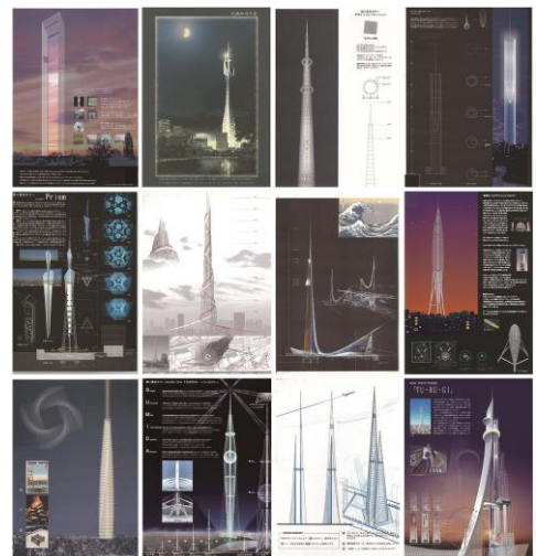
△展示されるデザイン案（一部）