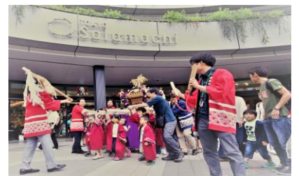
△「東京ソラマチ おみこしわっしょい！」 （過去の様子）