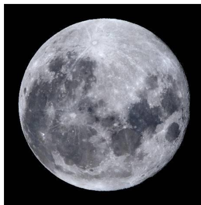
△天体望遠鏡で見る中秋の名月 (イメージ)