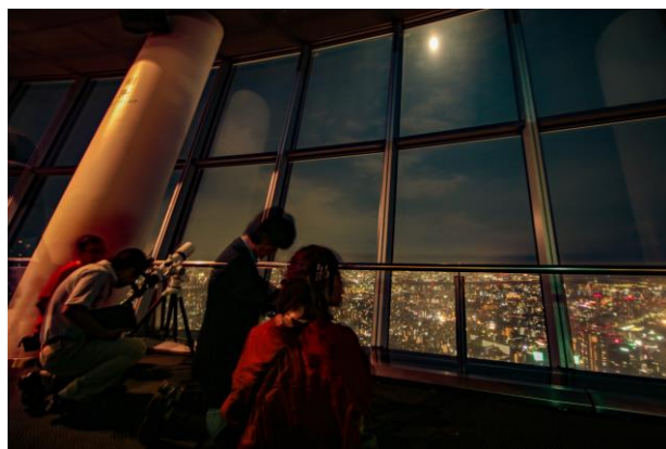
△天望デッキでの名月観賞会 (過去の様子)

2017年、「特に後世に残したい名月」として「日本百名月」にも認定された東京スカイツリーの展望台からの名月をお楽しみください。