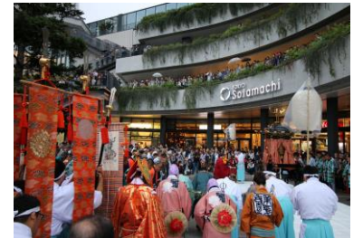
△世界平和祈願祭（過去の様子）