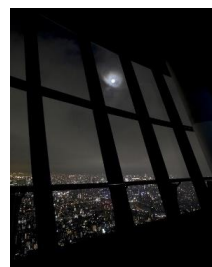
△天望デッキから望む月

月の魅力を時代に即した観光視点から捉え、日本の夜景資源へと昇華させること目的に、日本各地にある美しい名月の魅力を国内外の観光客にアピールし、日本の名月の観光資源化を目指すプロジェクト。