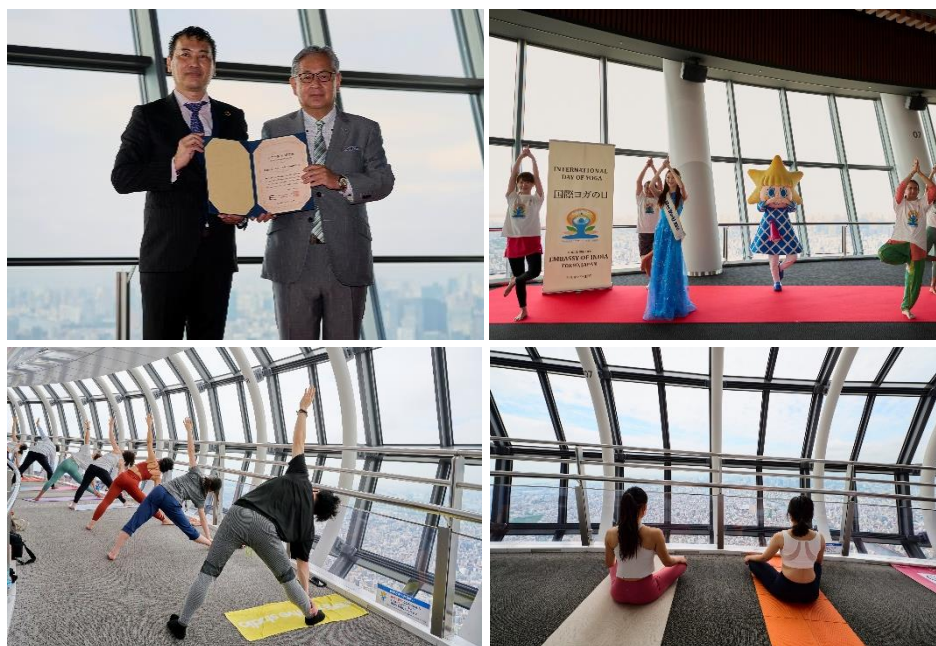
△認定イベント当日の様子

認定式終了後は地上450メートルの天望回廊にてヨガレッスンも実施。幻想的な景色が広がるなか、35名の方が早朝のヨガを満喫しました。