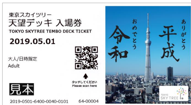
△東京スカイツリー天望デッキ入場券面への印字イメージ