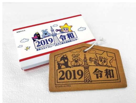
東京スカイツリー® 令和 絵馬クッキー 650円

4月26日（金）から販売。1804年創業の銀座松崎煎餅を代表する瓦煎餅。外箱は桐箱仕様／6枚入り。