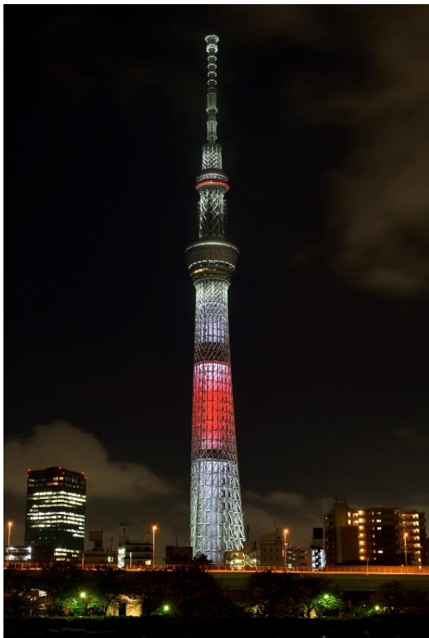
△日本国旗をイメージしたライティング(イメージ)