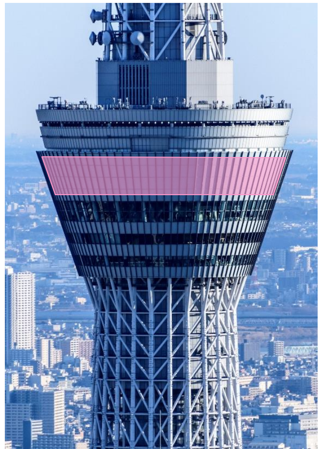
△レーザーマッピングで演出する天望デッキ