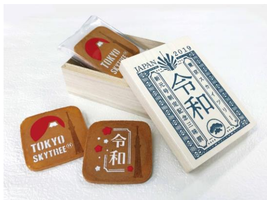
東京スカイツリー® 令和 三味胴 2,084円

場 所 東京スカイツリーオフィシャルショップ「THE SKYTREE SHOP」1階、5階 ※一部の商品は天望デッキフロア345でも販売。