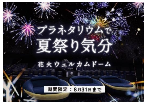
▲「花火ウェルカムドーム」(イメージ)

期 間：7月11日(土)～8月31日(月) 時 間：作品上映前の約10分間 ※作品上映時間はホームページにてご確認ください。 場 所：東京スカイツリータウン® イーストヤード 7階 料 金：鑑賞無料 ※プラネタリウム作品をご覧いただくための鑑賞料金がが必要です。 ※金曜限定プログラム「LIVE in the DARK-w/Quartet-」は除きます。