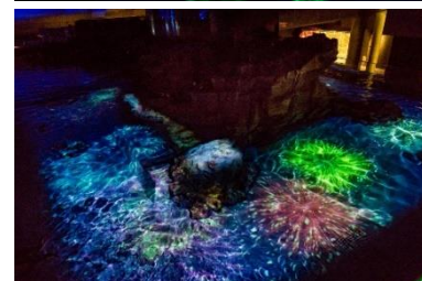
「ペンギン花火」(過去の様子)▶