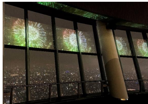
▲「SKYTREE ROUND THEATER®」(イメージ)

期 間：7月11日(土)～8月31日(月) 時 間：19:45/20:15/20:45(各回約4分) ※時間は変更となる場合があります。 場 所：東京スカイツリー天望デッキ フロア350 料 金：鑑賞無料 ※東京スカイツリー天望デッキへは入場料が必要です。