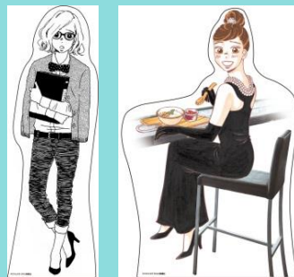
▲カフェ内の装飾（イメージ） ▲フォトスタンディー（イメージ）