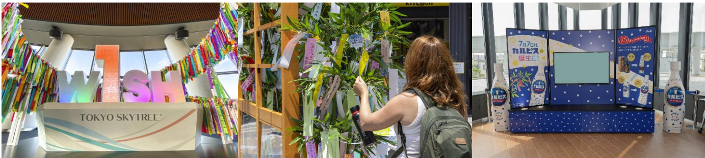
△ W1SH RIBBON

オフィシャルパートナーであるアサヒ飲料株式会社「カルピス®」の誕生日7月7日にちなみ、期間中、館内で短冊の飾りつけを行います。