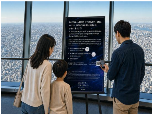
③ 二次元コードを読み込み専用フォームから投稿(イメージ)