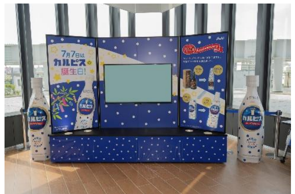
△カルピス®七夕イベントの様