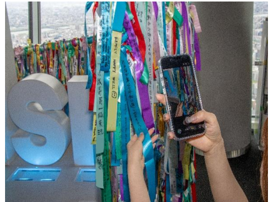
② 願い事を撮影する