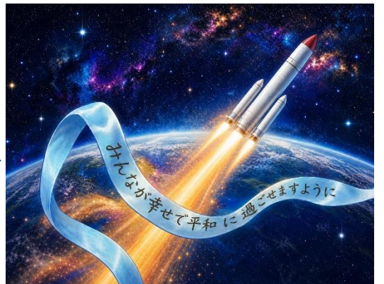
④ ロケットにデータとして搭載、宇宙に届ける(イメージ)