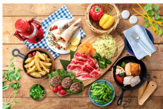
△コースメニュー (イメージ)