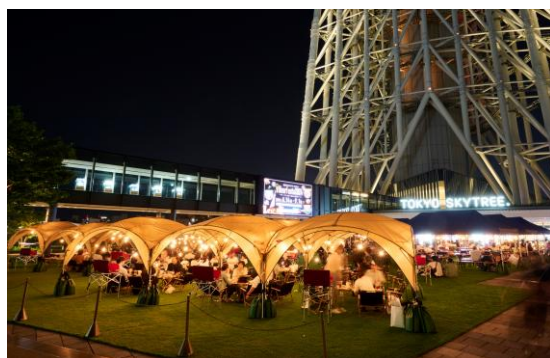
△過去の様子(昼・夜)