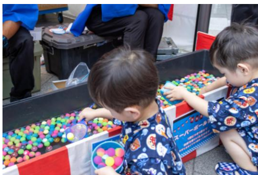
△ソラマチこども縁日(過去の様子)