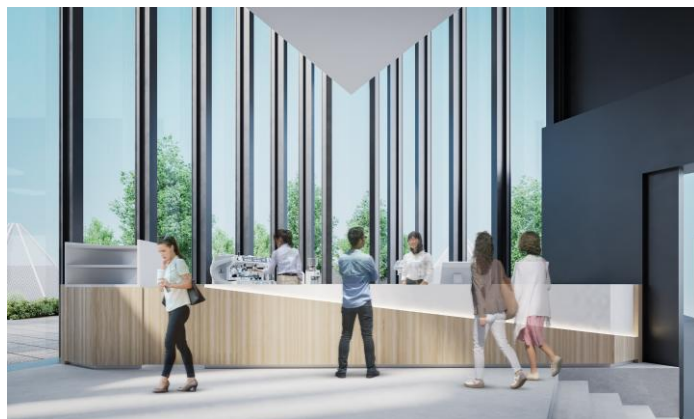
△ LOOK UP CAFE TOKYO SKYTREE 店内イメージ

東京スカイツリーを運営する東武タワースカイツリー（本社：東京都墨田区）は、 東京スカイツリー5階に、「LOOK UP CAFE TOKYO SKYTREE」を東京スカイツリー開業14周年を迎える2026年5月22日（金）にオープン します（展望台入場料金は不要です。どなたでもご利用いただけます。）。