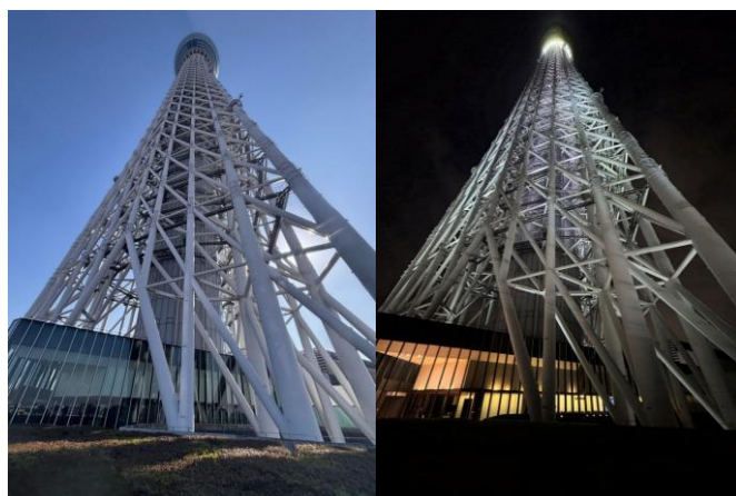
△テラスから見上げる東京スカイツリー