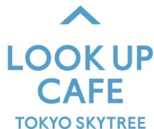
△ LOOK UP CAFE TOKYO SKYTREE ロゴ

「LOOK UP CAFE TOKYO SKYTREE」は、「真下からスカイツリーを見上げたくなる、特別な体験ができるカフェ」という意味を込め、思わず写真を撮りたくなる景色と、雲をイメージしたクレープや、東京スカイツリーのライティングをイメージしたドリンクなど、ここでしか味わえないカフェメニューをお気軽にお召し上がりいただけます。