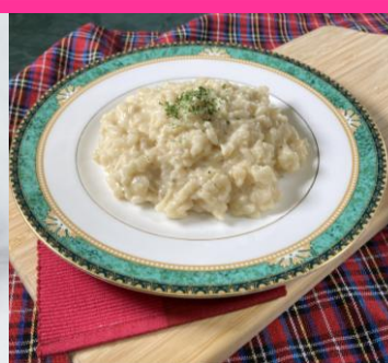
ポルチーニのチーズリゾット