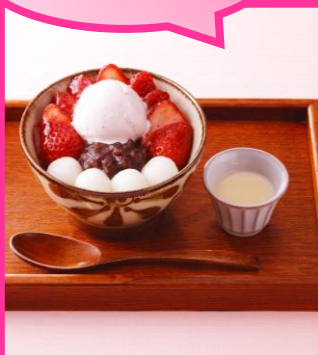
田ノ実 いちご雪見あんみつ