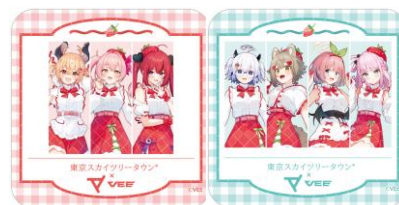
オリジナルコースター