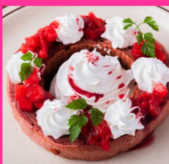
苺のパウムクーヘン ベリーソース