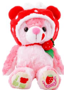
ご当地ピンズプラス 静岡ストロベア ぬいぐるみ