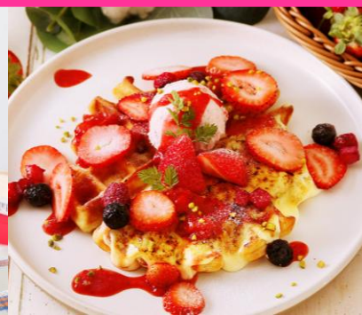
ココノハ 苺づくしの贅沢 ブリュレワッフル