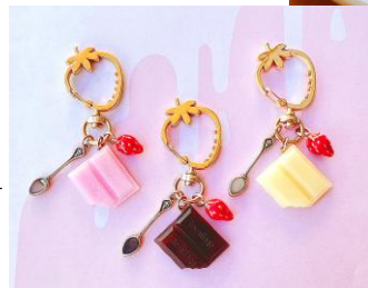
◁貴和製作所 UV-LEDレジンで作る いちごチョコレート キーホルダー