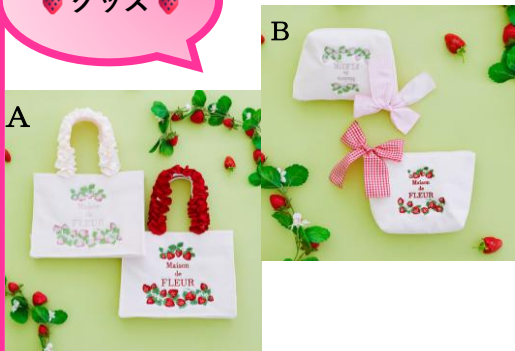
Maison de FLEUR A. いちごフリルハンドドル スクエアトートバッグ B. いちごポーチ