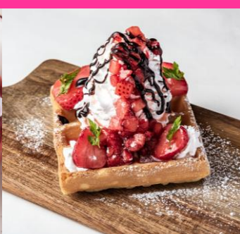
ベルギーワッフル (ストロベリー)