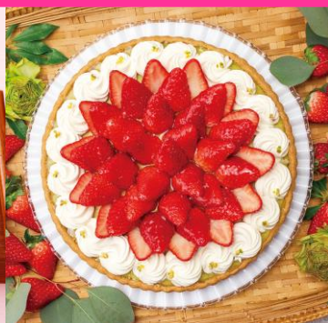
キルフェボン 静岡県産“さらび香”と ピスタチオのタルト