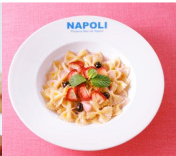
ピッツェリア マルデナポリ いちごのファルファッレ