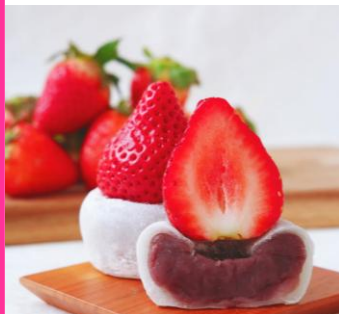
旬果瞬菓 共楽堂 大いちご大福