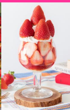
堀内果実園 いちご園