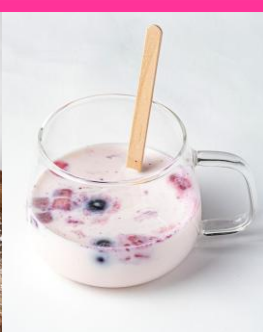
いちごミルクのカクテル (ノンアルコール)