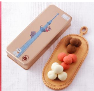
シャトロワ 東京スカイツリー®缶 苺の牛乳ショコラ3種