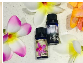
△オリジナルアロマ2本セット