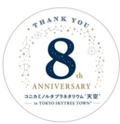
△8周年オリジナルステッカー