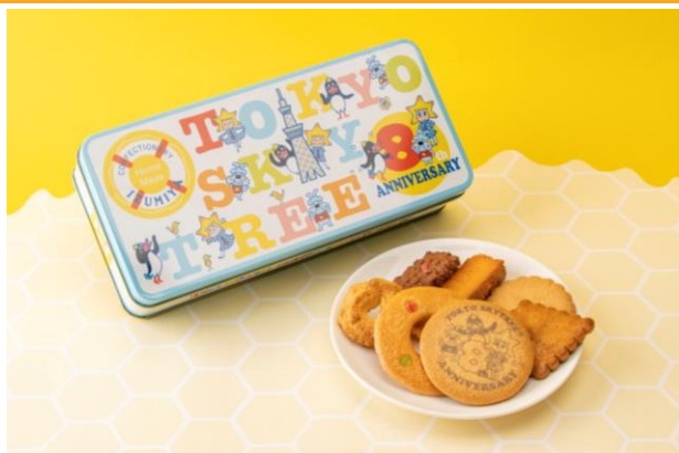
東京スカイツリー8th 泉屋クッキー缶 1,274円 (発売中)

やさしい甘さのハチミツ味キャンディーが8粒入っています。蜂になったソラカラちゃんが描かれた容器は、小物入れにもオススメです。