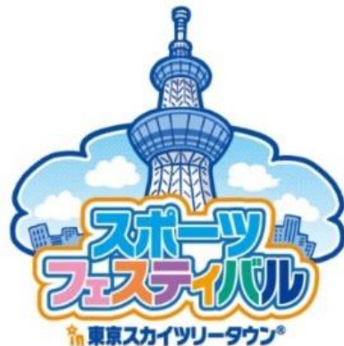
△スポーツフェスティバル ロゴ

このイベントに合わせて、東京スカイツリータウン1階の「TOKYO SKYTREE TOWN® STUDIO」では、文化放送のスポーツ情報番組『スポスタ☆MIX ZONE』（毎週日曜15：00～16：00放送）の公開生放送も実施されます。