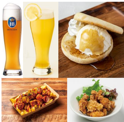
△ピクニックパークメニュー（イメージ）

期 間 9月5日（土）～10月4日（日） 時 間 11：00～19：00 場 所 東京スカイツリータウン4階 スカイアリーナ ※荒天時は中止する場合があります。 ※遊具は一部有料です。 ※詳細は、東京ソラマチHPにてお知らせします。 ( https://www.tokyo-solamachi.jp/ )