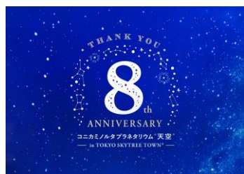
△メインビジュアル

また、対象作品を鑑賞した方の中から抽選で8名に、オリジナルダイヤモンドネックレスや上映中の作品「星と海に抱かれて アジアンヒーリング」をイメージしたオリジナルアロマセットをプレゼントします。