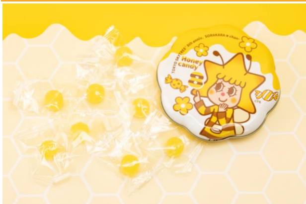
ソラカラちゃん ハニーキャンディー缶 8周年アニバーサリー 864円 (発売中)

やさしい甘さのハチミツ味キャンディーが8粒入っています。蜂になったソラカラちゃんが描かれた容器は、小物入れにもオススメです。