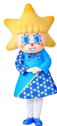
△新ユニフォームコスチューム