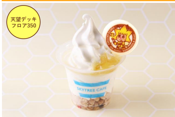
8みつレモンソフト 580円 (販売期間：9月4日(金)～10月4日(日))

人気の「スカイソフト」に甘酸っぱいレモンジュレと優しい甘さのハチミツをトッピング。オリジナルクッキーが付いた限定メニュー。