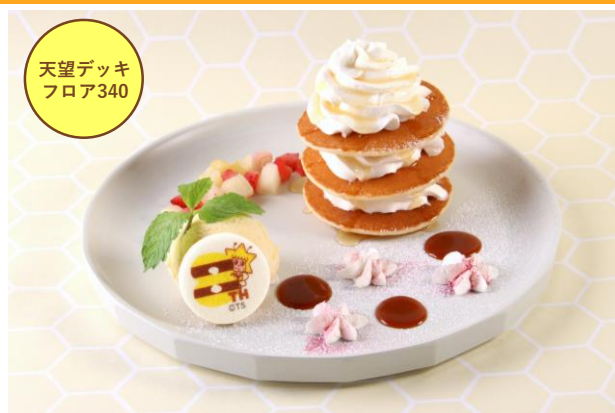
8みつパンケーキ 880円 (販売期間：9月4日(金)～10月4日(日))

人気の「スカイソフト」に甘酸っぱいレモンジュレと優しい甘さのハチミツをトッピング。オリジナルクッキーが付いた限定メニュー。