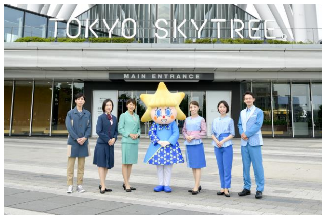
△10月1日から着用する東京スカイツリーの新ユニフォーム