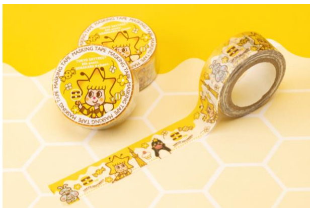
ソラカラちゃん マスキングテープ 8周年アニバーサリー 418円 (発売中)

日本で初めてクッキーを販売した泉屋のクッキーを7種14枚詰め合わせました。8周年をお祝いするプリントクッキーも入っています。