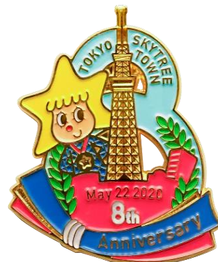
△8周年記念ピンバッジ

東京スカイツリータウンの対象店舗で1会計1,000円(税込)以上お買い上げの方に「8周年記念ピンバッジ」をプレゼントします。グランドオープンから毎年コレクションしているお客さまもいらっしゃるオリジナルピンバッジです。10月1日(木)から着用する東京スカイツリー®の新ユニフォームにも取り入れられる着物の帯をイメージしたデザインが特徴です。