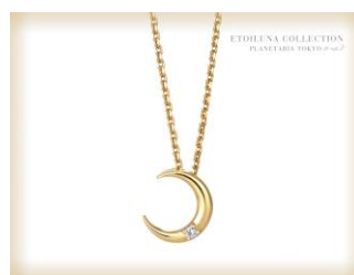
△オリジナルダイヤモンドネックレス