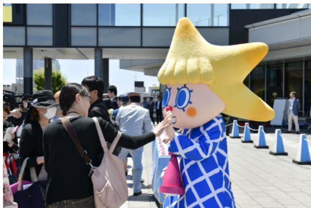
△昨年の記念品プレゼントの様子