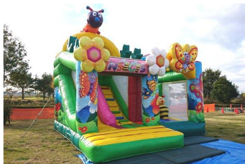
△アトラクション（イメージ）