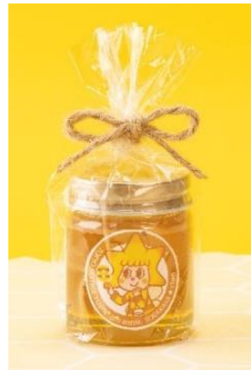
△8周年記念ハチミツ

整理券を配布し、お客さま同士の距離を開けてお並びいただくなど、感染症対策を行い実施します。