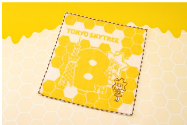
ソラカラちゃん ミニタオル 8周年アニバーサリー 792円 (発売中)

ソラカラちゃん、スコブルブル、テッペンペンのイラストが可愛いマスキングテープです。