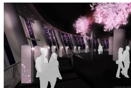
▲天望デッキの桜の特別演出(イメージ)

桜の装飾は、大胆な空間演出で話題を集めるクリエイティブカンパニーである、株式会社ネイキッドが演出、制作します。花をテーマにした体験型デジタルアート展『FLOWERS by NAKED 2017』のメイン作品『桜彩』とコラボレーションした桜を設置するほか、夜になると特別な光の演出が施され、幻想的なお花見の空間を作り上げます。