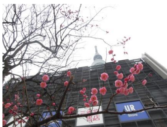
ウメ 2月中旬～ 【ハナミ坂ひろば】