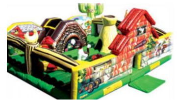
▲「ジャングルふわふわ」(イメージ)

料 金 大人800円、子ども(9歳以下)500円、2歳以下無料、親子券1,200円