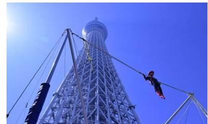
▲ジャンプゾーン(過去の様子)