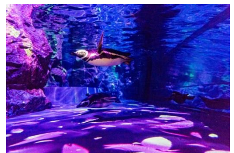
▲ペンギンピクニック(過去の様子)