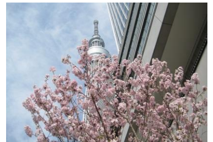
▲桜と東京スカイツリーの様子(過去の様子)

東京スカイツリー®の足元にて、桜を眺めながらお花見をお楽しみいただけるほか、ソラマチ商店街にもさくらにちなんだスイーツやさくらメニューが登場します。