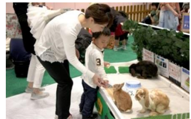
▲「可愛い動物たちがいっぱい！春のアニマルパーク」(イメージ)

小さなお子さまに人気のうさぎや犬、猫などの可愛い小動物のほか、リクガメ、ミーアキャット、アルマジロ等の珍しい動物たちとも触れ合える「可愛い動物たちがいっぱい！春のアニマルパーク」を開催します。また、動物をイメージしたエア―遊具「ジャングルふわふわ」も設置します。