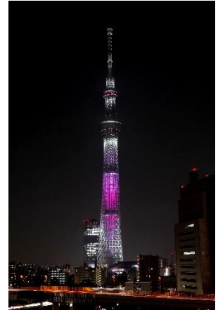
▲特別ライティング“舞”(過去の様子)

※各日とも22:00～24:00は通常ライティング「粋」または「雅」を点灯します。