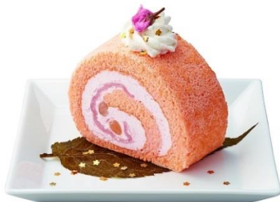
▲nana's green tea「桜と餅の金箔ロールケーキ」 ¥734