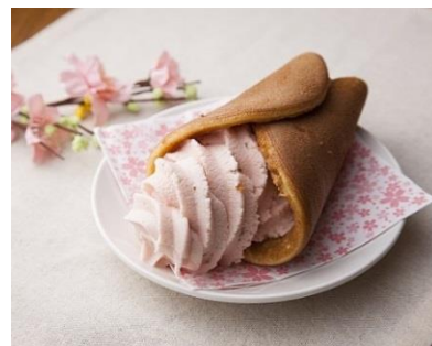
▲浅草梅園「桜・どらソフト」 ¥400 (東京ソラマチ限定)