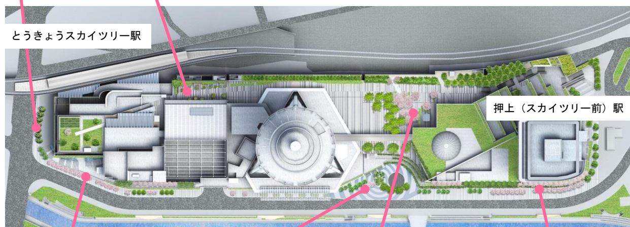
とうきょうスカイツリー駅