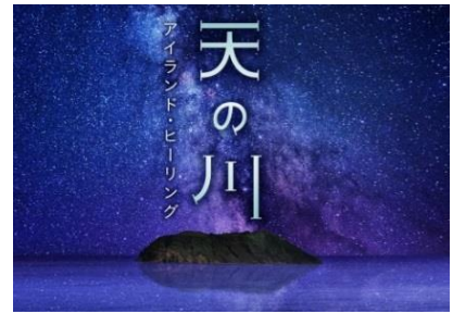
▲天の川 アイランド・ヒーリング(イメージ)

東京都青ヶ島の夜空を飾る天の川や美しい自然、土地の民謡など、島の魅力を紹介するプラネタリウム作品「天の川アイランド・ヒーリング」を上映します。青ヶ島の村の花であるユリをベースにした香りや天の川をイメージした香りの中で、人気声優の福山潤さんがナレーションを担当し、安らぎの空間を演出します。