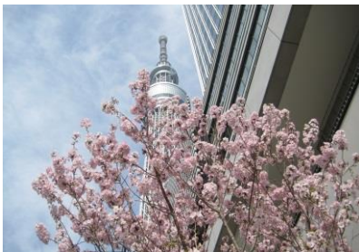
▲桜と東京スカイツリーの様子(過去の様子)