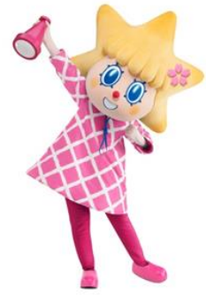
▲春限定の桜色コスチュームのソラカラちゃん!(イメージ)