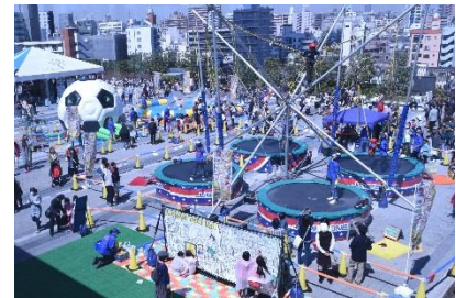
▲春休み！ソラマチわくわくパーク(過去の様子)

東京スカイツリー®の足元で、幼児から小学生を中心としたお子さま向けアミューズメントパークをオープンします。高さ最大7メートルまでジャンプできる「ジャンプゾーン」や直径1.5メートルのボールの中に入って水上を自由に動き回ることができる「バブルボール」、空気で膨らませた巨大ないもむし型のエア―遊具「キャタピラーふわふわ」が登場し、3種類のアトラクションを楽しめます。今回新たに、ビールやチュロスなどを販売する飲食ブースが併設しているため、休憩しながらお楽しみいただけます。