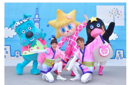
▲ソラカラちゃんのサクラ☆ダンス!(イメージ)

東京スカイツリー公式キャラクターのソラカラちゃん・スコブル・テッペンペンと一緒に、桜をイメージした和楽器の音色が入った和テイストの楽曲で楽しく踊れる春限定参加型ダンスプログラムを開催。「みんなで春を楽しもう!」をテーマに春らしいポーズを取り入れたダンスで、わくわくする春をお楽しみいただけます。