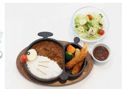
▲カチコチ南極“ドラ”イカレー ミニサラダ付き 1,650円