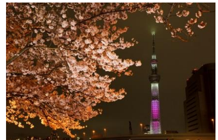
▲桜と特別ライティング“舞”(過去の様子)