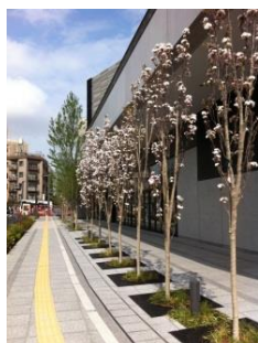
アミノガワ（サクラ） 4月中旬～ 【ウエストヤード1階】