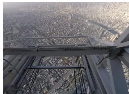
▲「体験!東京アオゾラそうじ」の体験イメージ