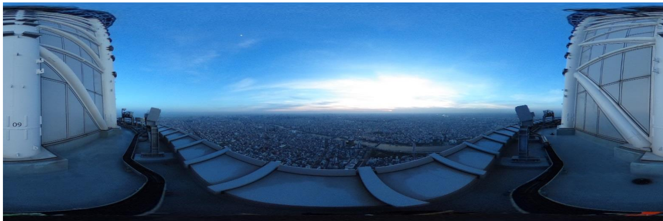
▲「東京スカイツリー®スコープ」コンテンツ映像イメージ(360度映像を平面に展開)