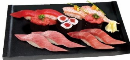
△極上まぐろざんまい<大名椀付き> 5,808円