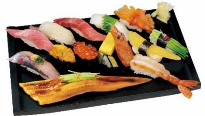
△特選すしざんまい<大名椀付き> 4,708円