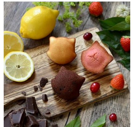
△シモーヌ 6個入 1,620円 9個入 2,980円