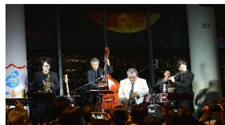
▲「Jazz in the Moon night」(昨年の様子)

地上350メートルの東京スカイツリー天望デッキで、9月7日(金)、14日(金)、21日(金)、28(金)の合計4日間、日本を代表するサクソフォーン奏者のMALTA氏率いるJazzユニット「MALTA Planet Band」およびシンガーソングライターのJILLE氏によるJazzライブを開催します。名月に照らされた東京の夜景を眺めながら、月にまつわるJazzの名曲など上質な音楽とともに贅沢な秋の夜長をお楽しみ下さい。