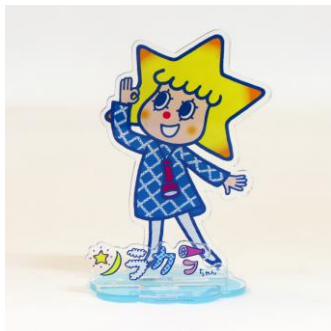
組み立てイメージ▷