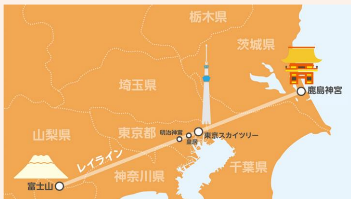
△鹿島神宮と富士山を結ぶレイライン

そして、皆さんの一番かなえない願いが込められたリボンは、レイラインはじまりの場所に位置する鹿島神宮（茨城県鹿嶋市）にお納めします。