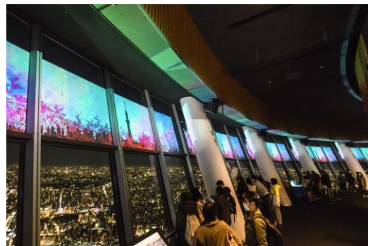
△上映の様子（イメージ）