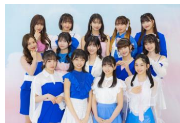
モーニング娘。'23

2023年1月よりアーティスト名を「モーニング娘。'23 (もーにんぐむすめとぅーすりー)」に改名。メンバーの加入と卒業を繰り返し、6月に新メンバー2名が加入して現在14名で活動中。今秋ツアーをもってリーダーの譜久村聖が卒業する。