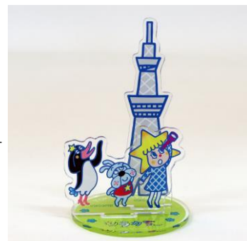
組み立てイメージ▷

キャラクターアイテムの定番アクリルスタンド！自宅や職場のデスクでも「推し活」しちゃいましょう！（約H10cm×W6cm）