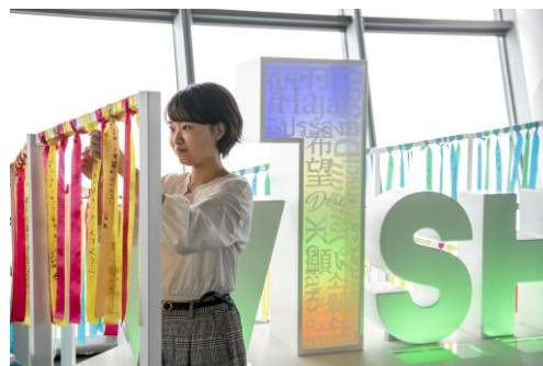
△リボンを結び付ける様子