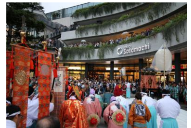
△世界平和祈願祭(過去の様子)