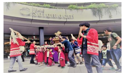
△「東京ソラマチ おみこしわっしょい！」 (過去の様子)