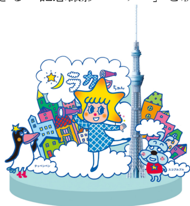
△記念撮影コーナー

東京スカイツリーにまつわる数字をクイズにした「スカイツリーQ&Aコーナー」や、人気の「ソラカラちゃん」と撮影ができる「記念撮影コーナー」を新設します。