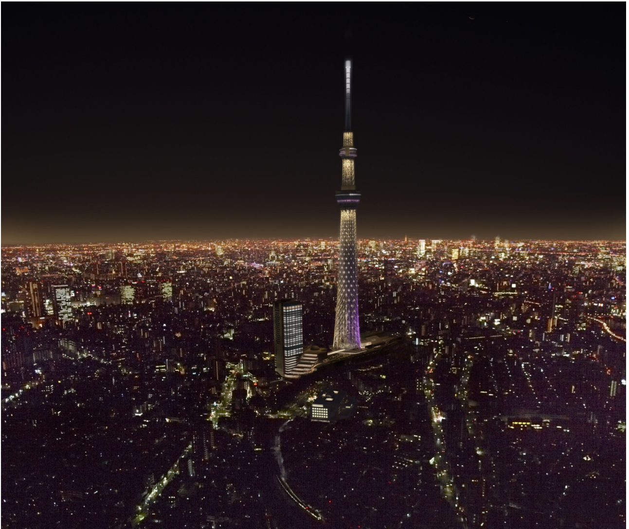
過去と未来をつなぎ、人々の心を届けるタワー