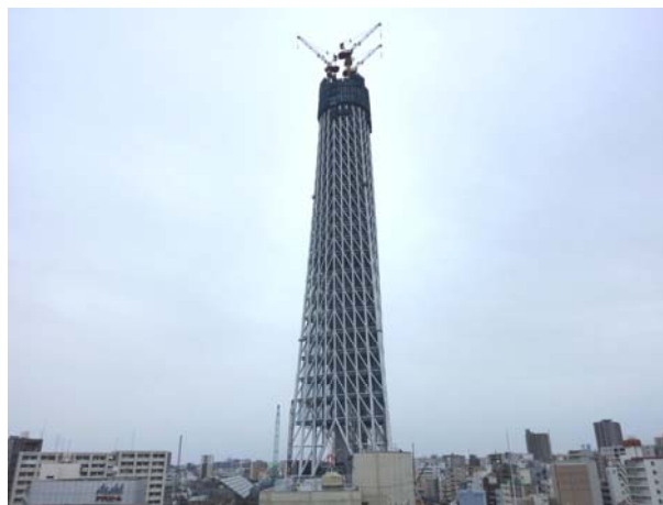
東京スカイツリー工事状況

2年後の開業に向けて今後も安全第一に工事を行ってまいります。今しか見ることのできない成長中の東京スカイツリーをどうぞ温かく見守ってください。